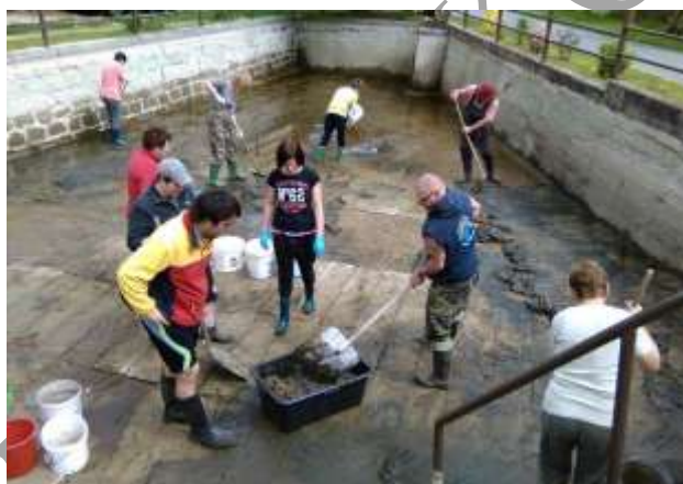
● Čištění požární nádrže – 2015

Obec neleží v záplavovém území, nejsou zde žádné přírodní vodní plochy, ani přírodní vodoteče.