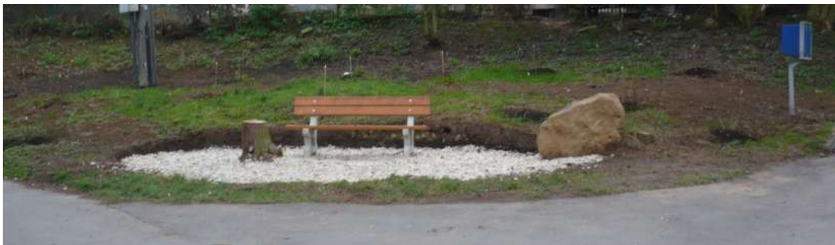
Parkové úpravy Dolní Vrátkov - 2014