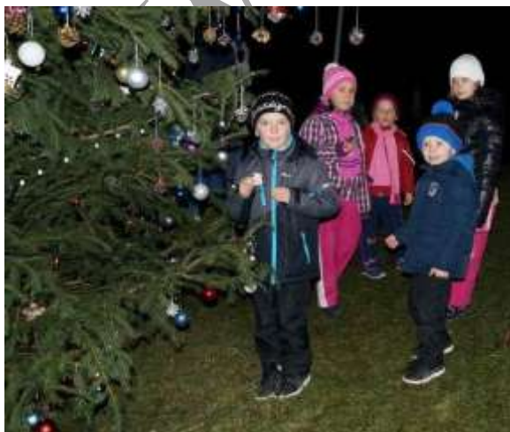
Společné zdobení vánočního stromu - 2015

V obci se nenachází žádná budova, která by byla aktuálně vhodná pro pořádání kulturních akcí.