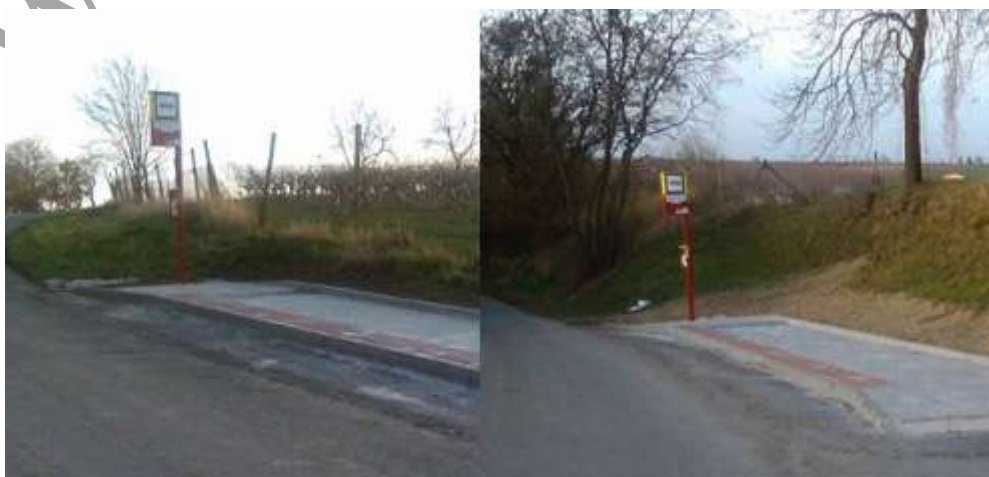
Zastávky u hřbitova, Tismice - 2015