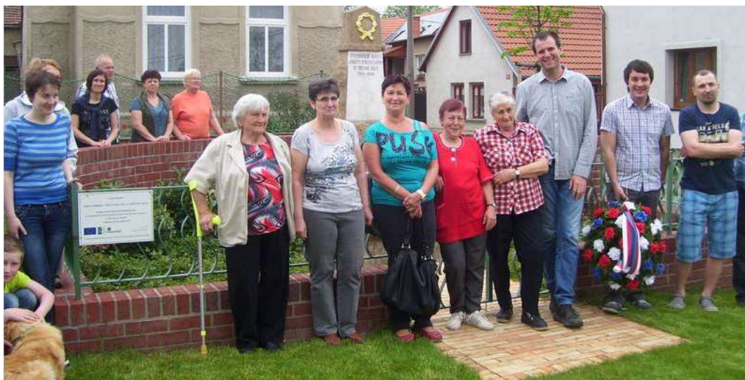
Uctění památky padlých, Památník padlým v 1. světové válce - 2015