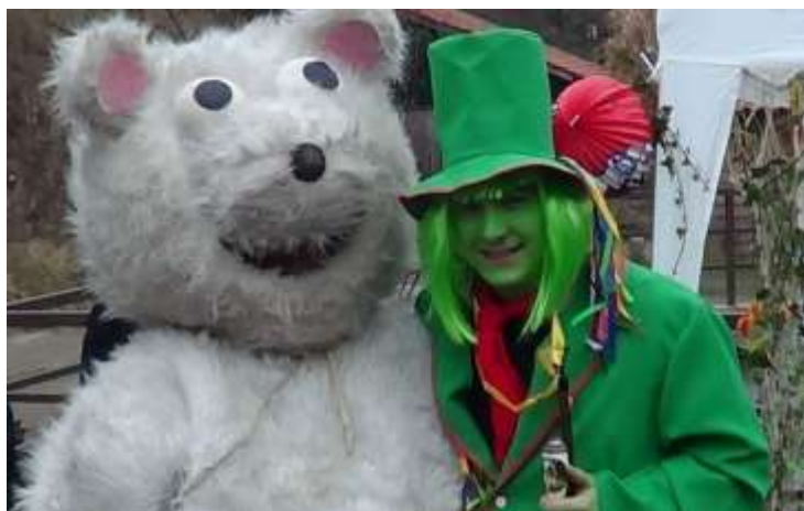
Masopust - 2015