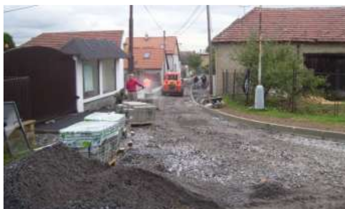
Rekonstrukce komunikace „Za Pomníkem“ – 2015

Budování a rekonstrukce místních komunikací je dlouhodobý a trvalý cíl, jenž je průběžně realizován převážně z rozpočtu obce, s ohledem na jeho možnosti. Asfaltové komunikace a chodníky jsou na hlavních cestách a v části dlouhodoběji a hustěji obydlené zástavby. V roce 2015 byla v obci zrekonstruována komunikace „Za Pomníkem“, celkové investice na ni činily cca 1,2 mil. Kč z rozpočtu obce. Zejména v částech nejnovější zástavby vyhovující komunikace a chodníky dlouhodobě chybí, chybějících rozsah odpovídá cca 3 nákladným hlavním cestám.