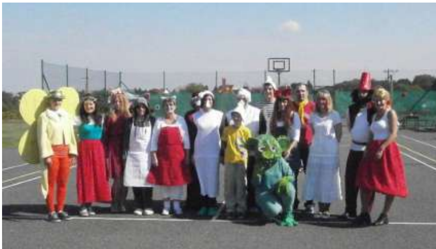
Odpoledne s večerníčky - 12.9.2015