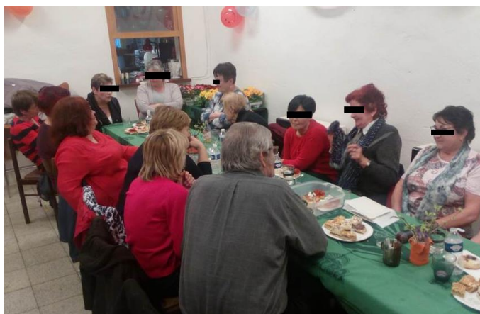
MDŽ 2019 – v „garáži“ u obecního úřadu

V obci se nenachází žádná budova, která by byla aktuálně vhodná/ pro pořádání kulturních akcí pro více než cca 20 osob.