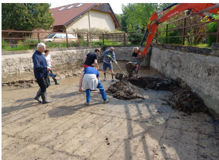
Čištění požární nádrže – 2023

Obec neleží v záplavovém území, nejsou zde žádné přírodní vodní plochy, ani přírodní vodoteče, ačkoliv některé lokality (K Pískovně, Dolní Vrátkov) byly opakovaně zatíženy lokální povodní způsobenou kombinací přívalového deště a nevhodně zvoleným osevním postupem na okolních polích (zejména výsevem slunečnice, kukuřice, řepky nebo obilí).