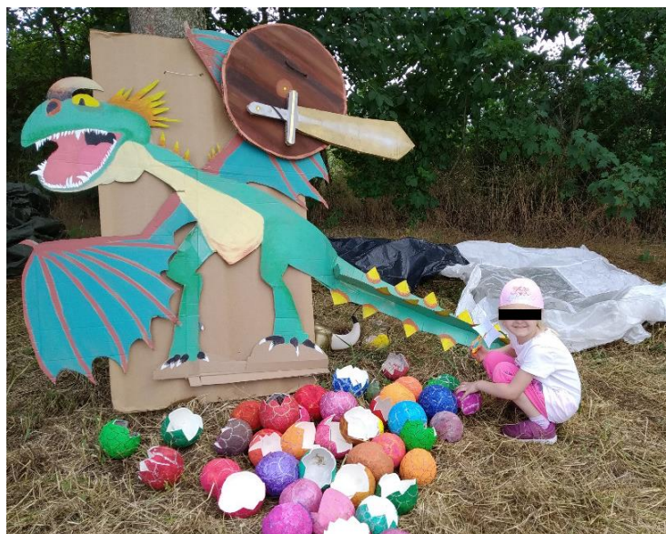
Den pro děti 2019 – Hřiště Vrátkov